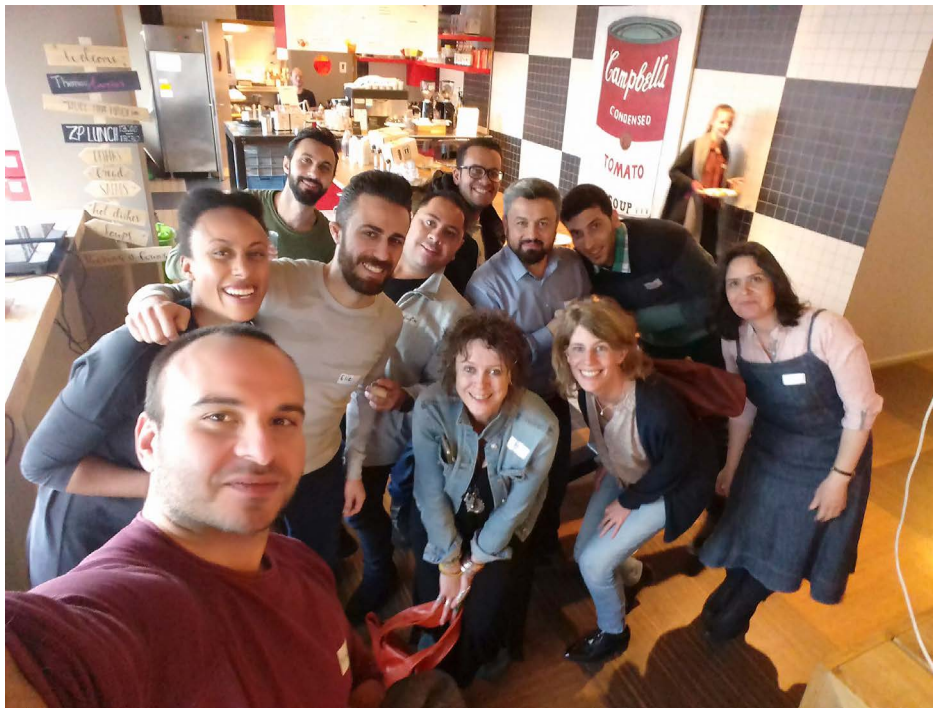
Matchmakers-training bij Seats2Meet in Utrecht.

Wij willen onze gastgezinnen bedanken voor hun gastvrijheid, onze gasten voor hun open blik en veerkracht, en onze vrijwilligers voor hun ongelooflijke inzet en betrokkenheid. Samen zijn zij het kloppende hart van Takecarebnb.